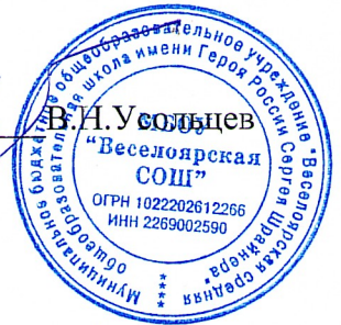
График проведения родительского контроля за организацией питания обучающихся МБОУ «Веселоярская СОШ» на 2024-2025 учебный год.